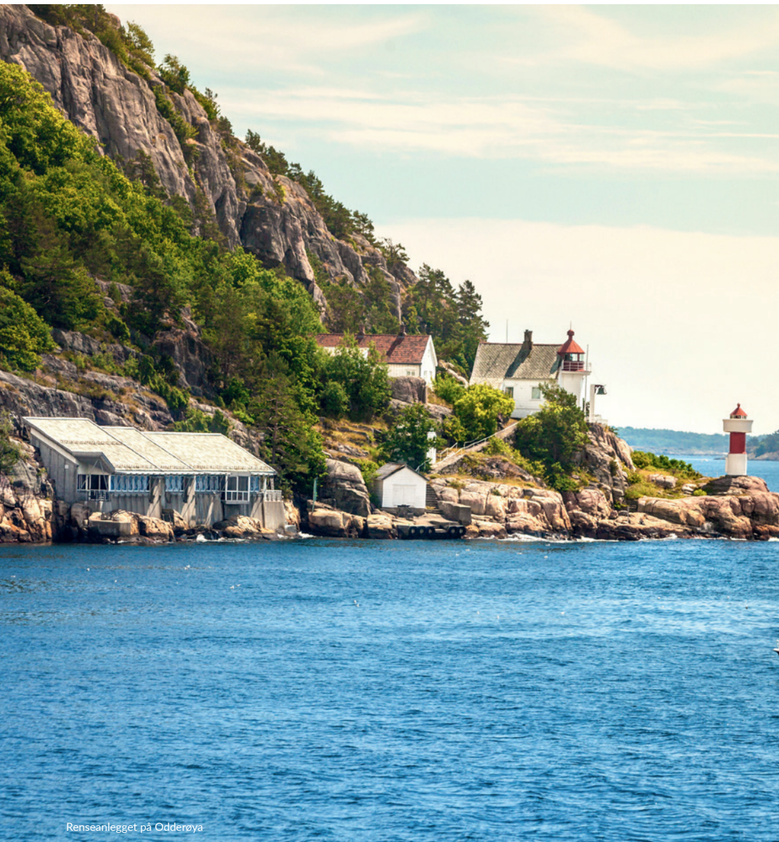
Renseanlegget på Odderoya