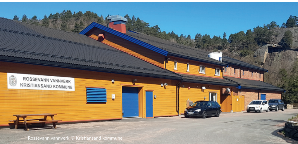
Rossevann vannverk

Tillegg: Største dimensjon på avløp fra svømmebasseng etc. er 32 mm.