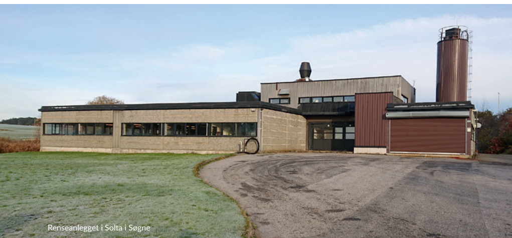
Renseanlegget i Solta i Søgne

Tillegg: Oppførings-/stigerør for stake-, spyle- og inspeksjonskum, skal være: – Min. 200 mm der kummen monteres i terreng. – Min. 315 mm i trafikkerte områder. Oppføringsrøret må avsluttes med teleskopløsning, og lokket skal være kjøresterkt. Lokket skal barnesikres og sikres mot inntrenging av overvann.